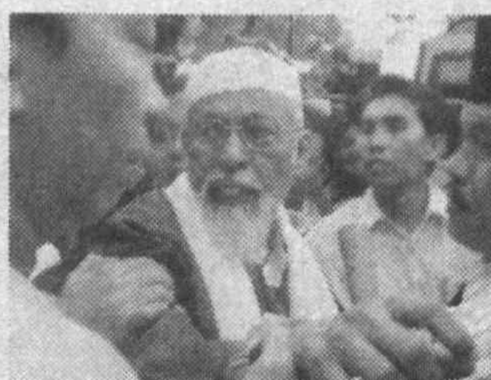
айтилишича, Баширни бир неча юзлаб тарафдорлари кутиб олган. Аслида у тергов даврида ҳам ҳибсда сақланган учун қамоқда жами 4 йил ўтказди. 67 ёшли етакчи ҳеч нарсада айбдор эмаслигини, «Жамоа Исломия» деган ташкилот эса умуман йўқлигини таъкидлади.

Индонезиядаги «Жамоа Исломия» ташкилот раҳбари Абу Бакр Башир қамоқдан чиқарилди, деб хабар беради «Рейтер» ахборот агентлиги. У 2002 йил Бали оролида юз берган ва 202 кишининг ўлимига сабаб бўлган террорчилик ҳаракатларига алоқадорликда айбланиб, 26 ойга озодликдан маҳрум этилган эди. Хабарда