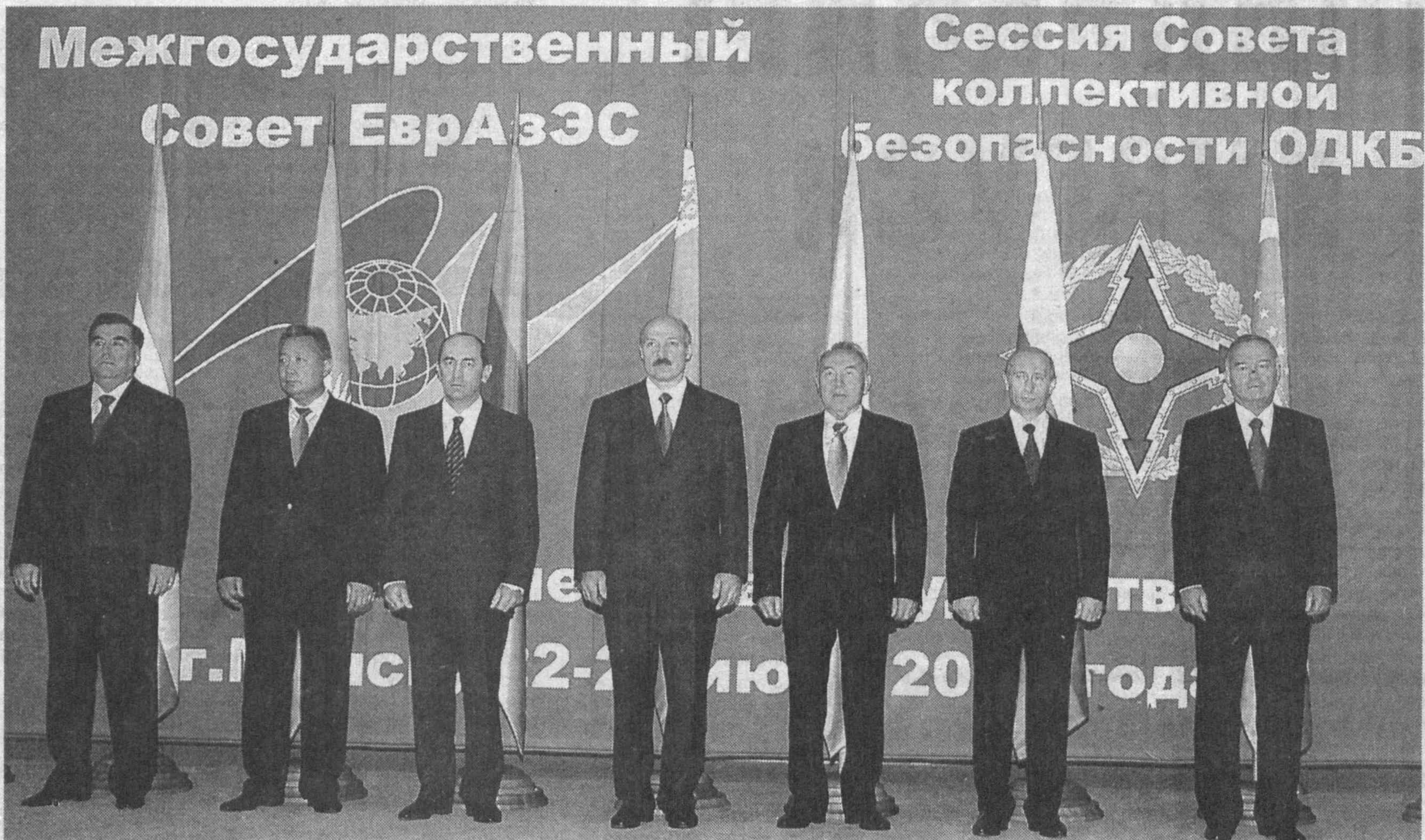
МИНСК, 23 июнь (Уза махсус мухбири Анвар Бобоев хабар қилади).

Евроосиё иқтисодий ҳам- жамиятининг саммитида қат- нашиш учун Минскта ташриф буорган олий мартабали меҳмонлар Беларусь Миллий кулубонасининг янги бунёд этилган биносига йиғилди- лар. Бу ерда Давлатлараро кенгашичи тор доирадаги уршаву бошланди. Унда Ўзбекистон Президентини Ислом Каримов, Беларусь Президенти Александр Лука- шенко, Россия Президентини Владимир Путин, Қозғистон Президенти Нурсултон На- зарбоев, Қирғизистон Пре- зиденти Курманбек Бакиев ва Тожикистон Президенти Имомали Раҳмонов қатна- шдилар.