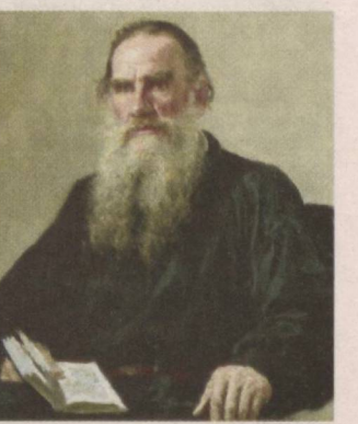
Лев ТОЛСТОЙ, рус адиби (1828–1910)

— Хўш, нима гап ўзи ёки сен менинг қароримдан норозимсан? — сўрабди қози шох Бойкосдан.