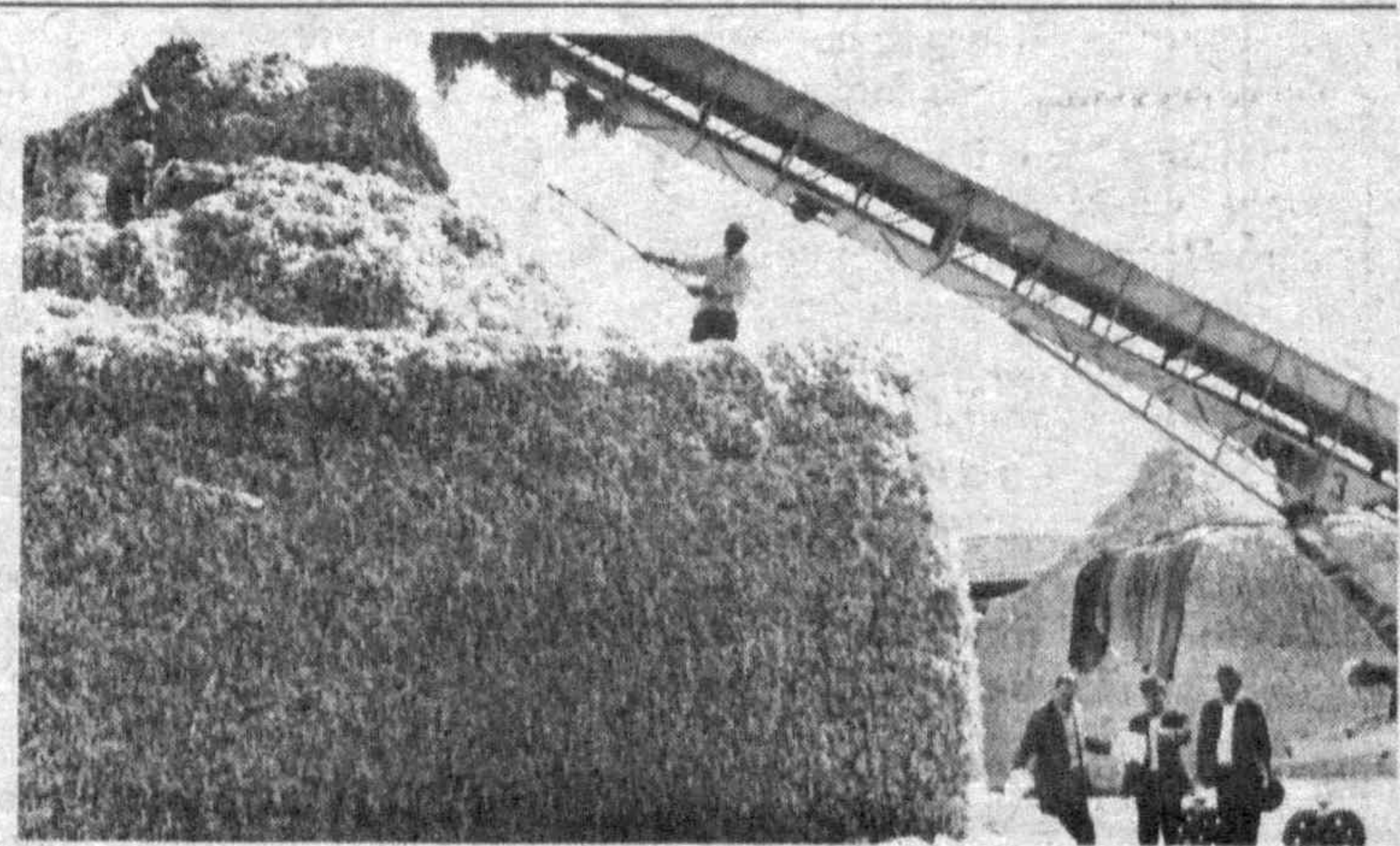
Растут бунты на Бектимирском арендно-опытном хлопкоочистительном заводе.