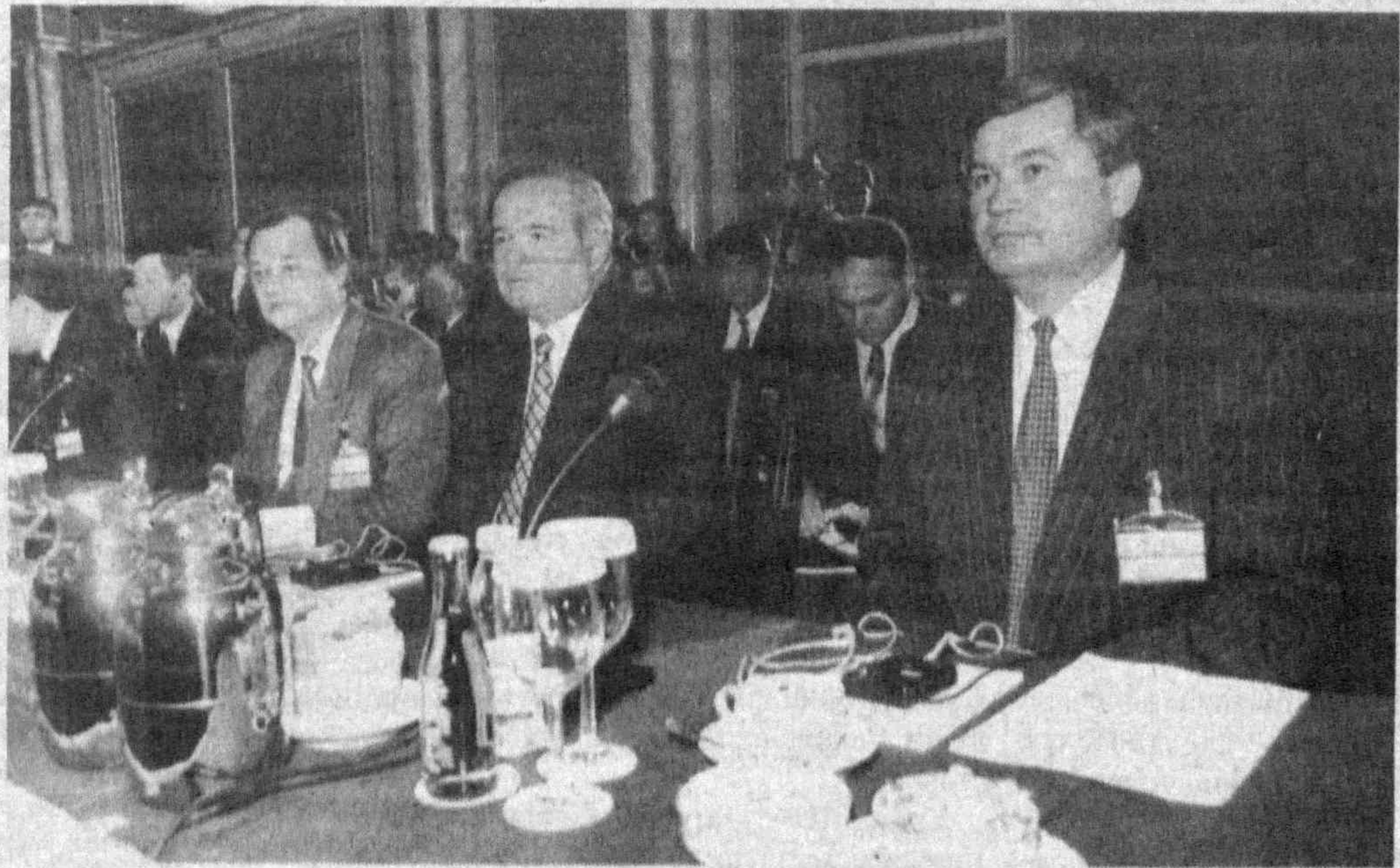
Во время встречи.

Итогом визита делегации Подмосковья станет подписание договора о сотрудничестве между Ташкентской и Московской областями.