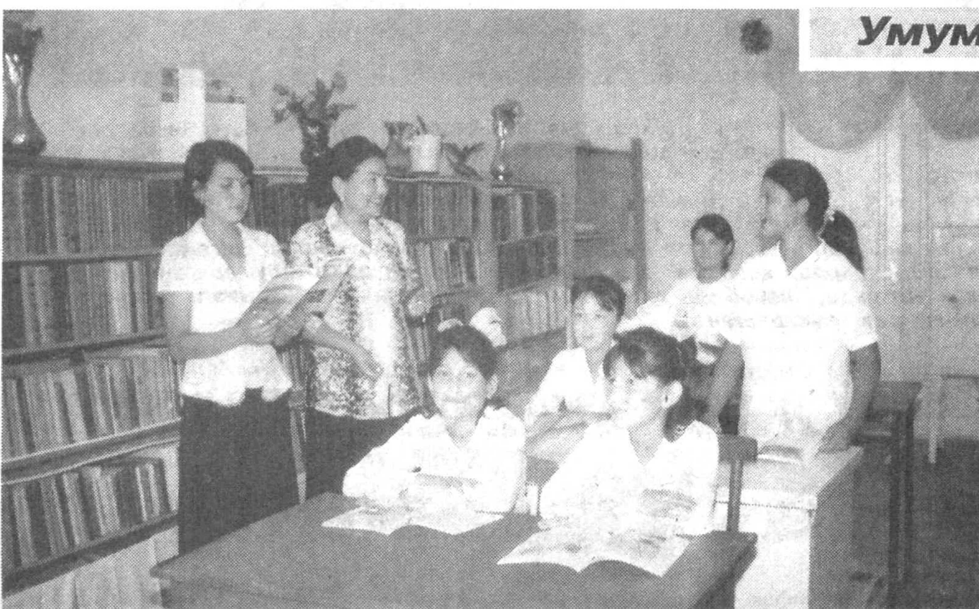
Ўтган йили тубдан қайта қурилган Чиноз туманидаги 26-умумий ўрта таълим мактаби замонавий кўринишга эга бўлиб, бу даргоҳда ўқиш учун барча шарт-шароитлар яратилди. Ўқув маскани янги парталар, мебеллар, стол-стуллар ва зарур ўқув жиҳозлари билан таъминланди. Мактабнинг синф хоналари билан танишган киши, бу ердаги шарт-шароитга фақатгина ҳавас қилади.