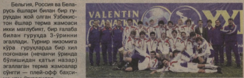
Россия ёшлар терма жамоаси турнир голиби бўлди.

Россиянинг Санкт-Петербург шаҳрида бир hafta давом этган футбол бўйича Валентин Гранаткин хотира турнири ўз ниҳоясига етди.