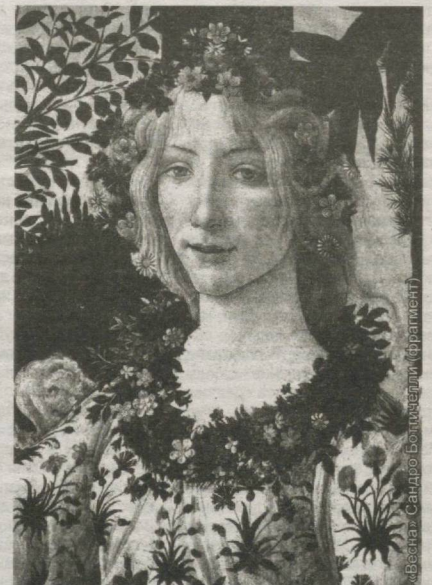
«Весна» Сандро Боттичелли (фрагмент)

Всё не случайно яровой называют пшеницу, посеянную под зиму и созревающую летом. Только сойдет снег – и дружно зеленеют поля, разбуженные весной.