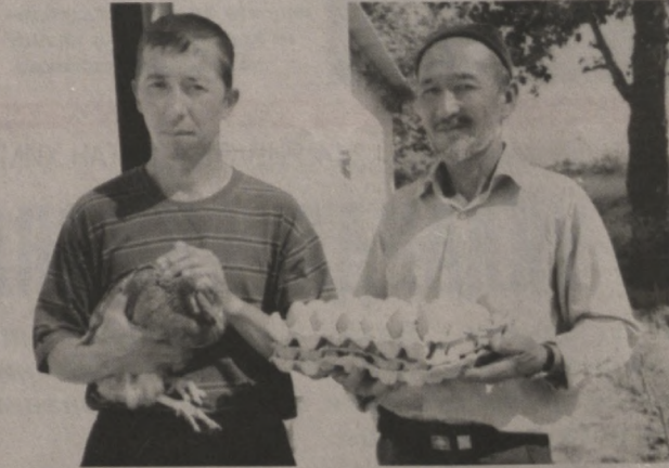
дан ортик гўшт, 500 килограммдан зиёд лимон, ҳар бир ишчи-га 1,5 килограммдан асал тарқатилди.

Бундан ташқари, ташландиқ қўйиш тартибига келтирилиб, галла, шоли, полиз ҳамда сабзавот экинлари парвариш қилинди.