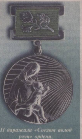
II даражали «Соғлом авлод учун» ордени.

Мазкур орденининг тасвирида бу жиҳатлар ўзига ҳос рамазий маъно-мазмун билан ифодаланган. Унинг ўнг қисмида қўшнинг илк нурлари қисмида фарзандни опичлаб турган она сиймоси акс эттирилган. Ватан тисмоли бўлган бу сиймо меҳр ва хотиржамлик билан фарзандига тикилиб турибди, беғубор ва бахтиёр бола эса қўш нурига – порлоқ келажакка талпинмоқда.