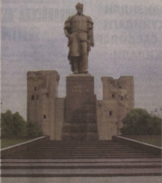
Шаҳрисабздаги Амир Темур номидаги майдонда соҳибқирон таваллудининг 676 йиллиги муносабати билан тадбир бўлиб ўтди.

Унда сўз олганлар Президентимиз ташаббуси билан нафақат мамлакатимизда, балки халқаро миқёсда Амир Темур хотирасини эъзозлаш, у ҳақдаги тарихий ҳақиқатни тиклаш борасида улкан ишлар амалга оширилгани, буюк бобока-