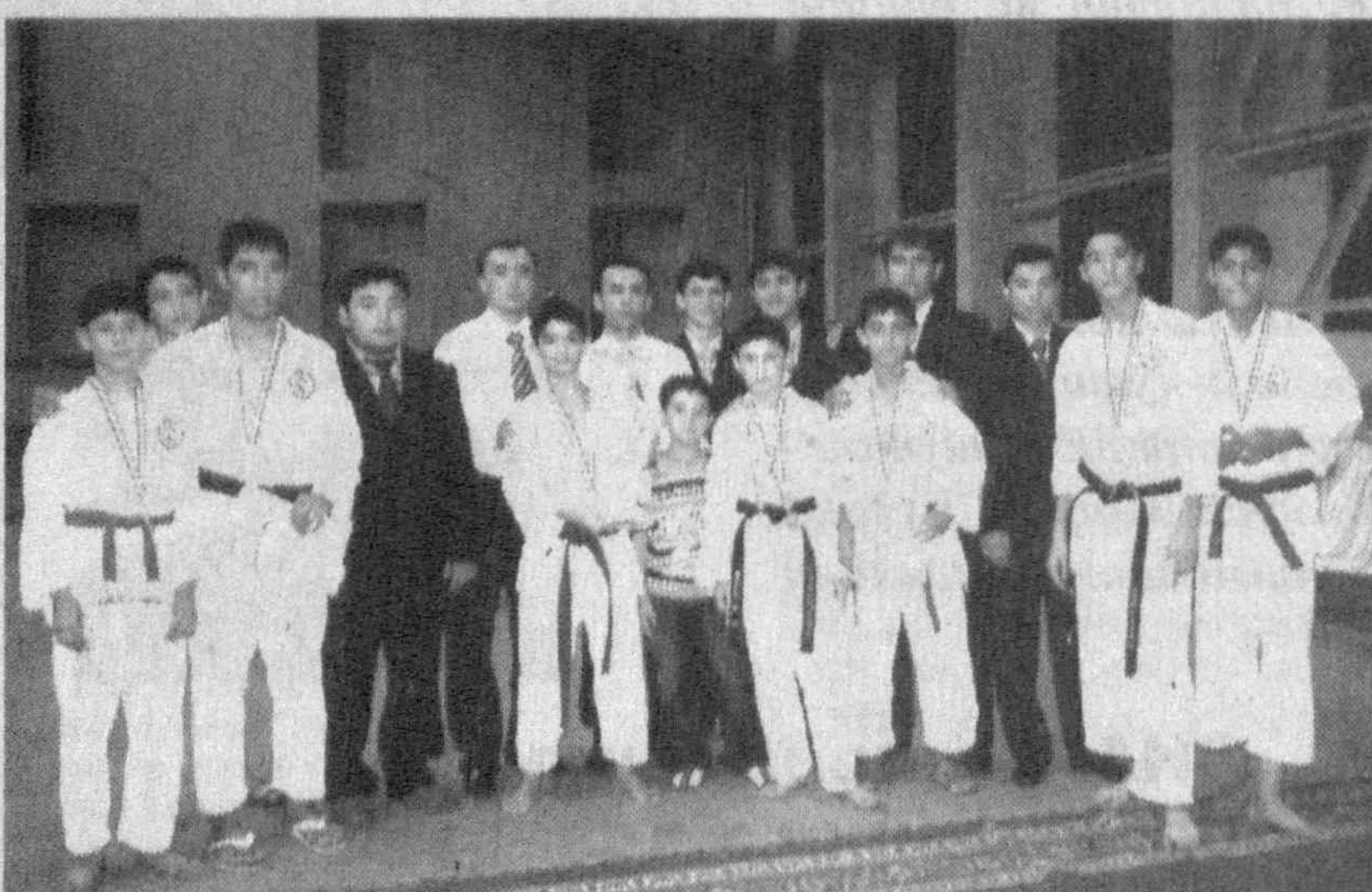
Кератэ мамлакатимизда энг оммалашган спорт турларидан саналади. Бугунги кунда етмиш минг нафардан ортиқ ўзбекистонлик ёшлар мазкур спорт тури билан мунтазам шуғулланадилар.

Пойтахтимиздаги «Жар» спорт мажмусида ёшлар ва ўсириллар ўртасида уюштирилган Ўзбекистон кубоги баҳслари ҳам мурасиз курашларга бой бўлди. Унда вилоятлардан келган минг нафардан ортиқ ёшлар иштирок этди. Мусобақа иштирокчилари нафақат голиблик, балки жорий йил декабрь ойида Қатар пойтахти — Доҳада ўтадиган XV Осиё ўйинларига йўлланмалар учун