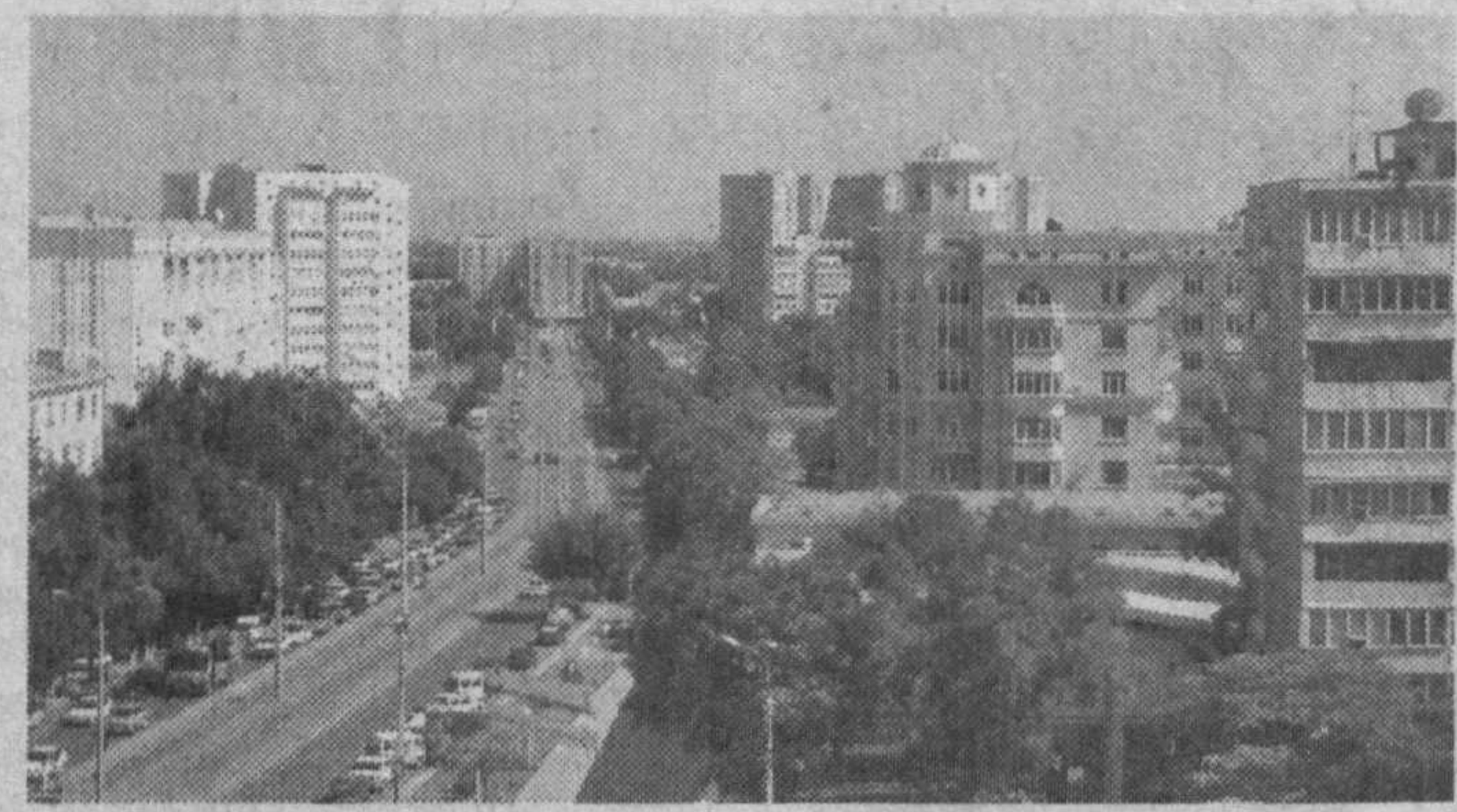
• Мамлакатимизда кўп қаватли уйлар 26 мингдан кўпроқ, • Уй-жой фондини 98 фоиздан зиёди хусусийлаштирилган.

Аввало, Фуқаролик кодексига киритилган ўзгартишлар ҳақида тўхталадиган бўлсак, айтиш жоизки, унинг 211-моддасидаги ўзгартишлар кўп квартиралар уйдаги мол-мулкнинг таркибини аниқлаштиришни назарда тутди.