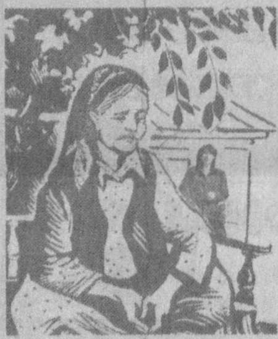
Кампир тушунди: чол келинболани авайлапти! Кампирга эса зимдан зарда қилиб:

Чол бошқа гапирмади. Аммо гап орасида: «Онаси, рўзгорини фақат келинға ташлаб қўйма. Кўрпсан-ку, у қўли-қўлиға теғ-май, гоҳ тандирга чопса, гоҳ чой қўйгани газжонга югурят-ти. Бу ахволда уни чарчатиб қўлмиз, биро қарашиб тур-гин», — деди.