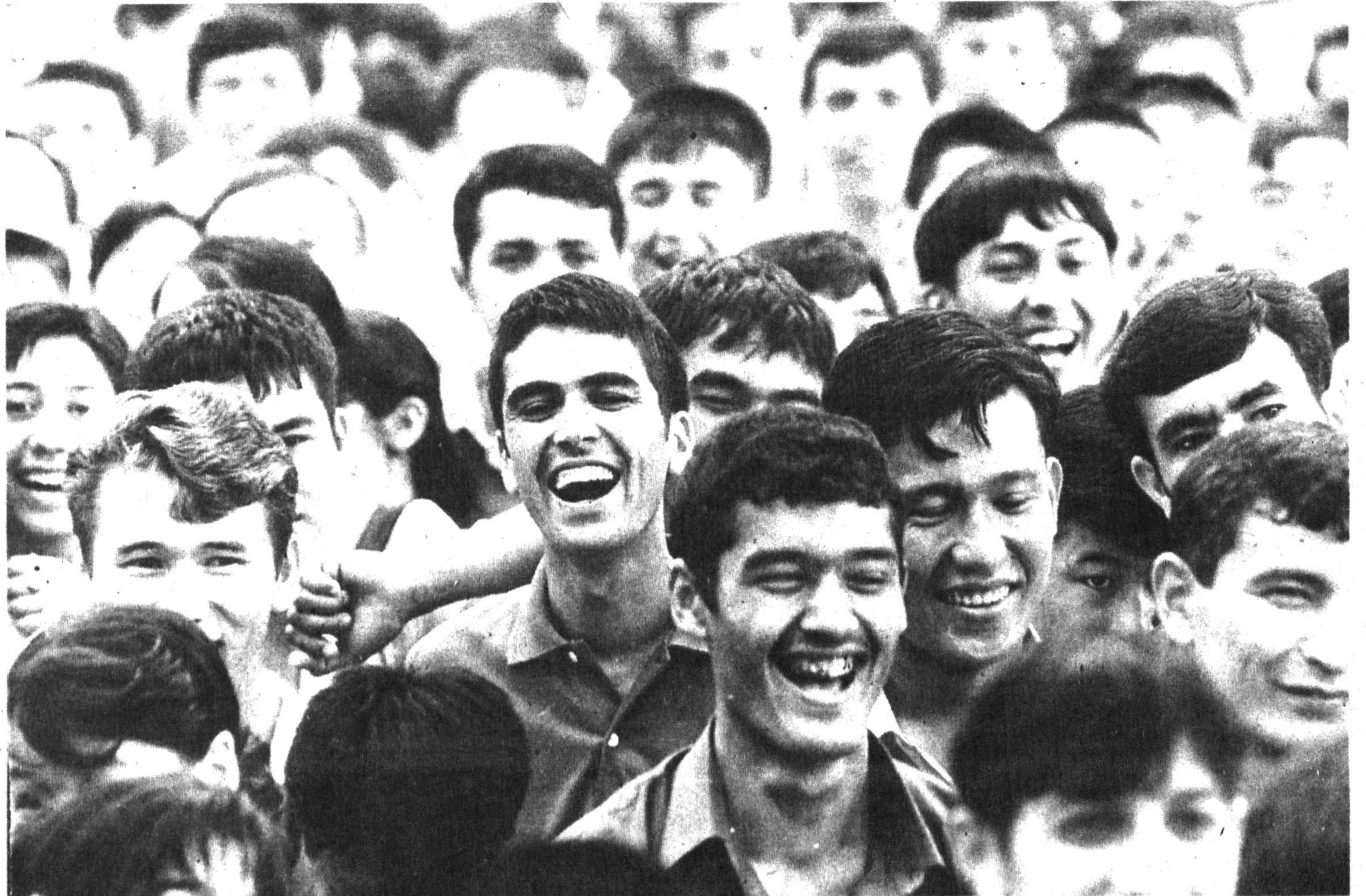
Позади — экзаменационная сессия. Впереди — каникулы!