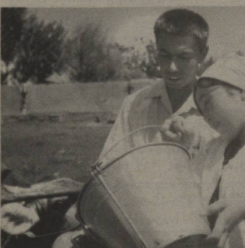
ферманнинг биноси, 34 гектар экин ери, 80 бош қорамол, 2 та техника воситаси ва бошқа ускуналари билан унинг иҳтиёжлари берилади. Қорамолчилик фермаси ўрамада “Омад юлдузлари шодаси” номи қорвачиликка иҳтисослаштирилган фермер хўжалиғи ташкил этилди. Хўш, фермер иши нимадан бошлади, дерсиз? У, энг аввало, қорвачиликнинг асосий неғизи ҳисобланган озқу-

экилиб, парвариш қилинмоқда. Жорий йил охирида эса яна 15 гектар майдон бедолага айлантирилади.