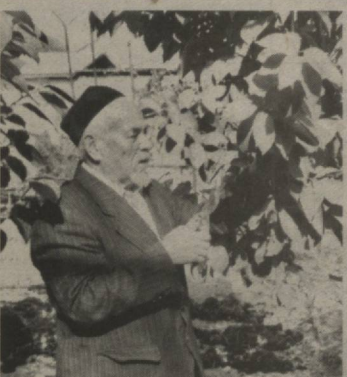
фоизини ташкил этди. Эллиқдан ортиқ фермернинг юзи ёруғ, қўлга қиритаётган ютуқлари салмоқли, даромади ҳам шунга яраша. Унинг 30-35 фоизини қишлоқ ободончилигига, эҳтиёжманд одамларга меҳр-муруват қўриштиришга сарфланаётганлиги ҳам диққатга сазовордир.

Масалан, Бўстон қишлоғидагилар асосан деҳқончилик билан шугулланишади. Пахта ҳамда галла етиштириш борасида бўстонликлар олдиға тушадиган деҳқон кам. Улар бу йил гектаридан 50 центнердан ошириб, галла етиштиришди. Пахта ҳосилдорлигини 45 центнерга етказиш тадбирларини қўришапти. 103 гектар майдондаги боғдан йиғиштириб олинган мева йиллик режанинг 120-125