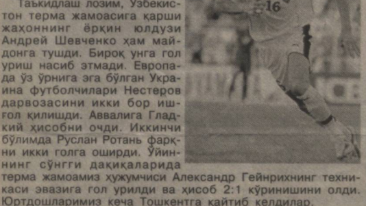
Украина — Ўзбекистон 2:1

Чоршанба оқшомида дунёнинг кўплаб терма жамоалари ўртоқлик ўйинларини ўтказишти. Шулар қаторида бош жамоамиз ҳам Киевга сафар уюштирди.