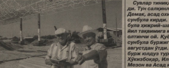
Шофиркон туман марказида барча қулайликларга эга бўлган деҳқон бозорининг байрам арафасида қурилиб ишга туширилётгани бу ерлик аҳоли учун аниқ муддао бўлди. Худуди 6,8 га майдонни эгаллаган ушбу бозорда халқ эhtiжи учун зарур бўлган барча турдаги махсуслотлар савдосини йўлга қўйиш режалаштирилган.

Муҳбирлик одатига кўра, аввало, унинг хаёт йўли билан қизиқдик. Равшанбой қулимсираб деди: