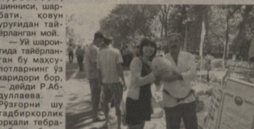
Лаззатли қовун ва унинг соҳиби - деҳқон билан эсдаликка суратга тушган япониялик хонимнинг ҳеҳриси гўлгун.