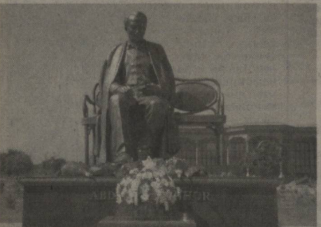
Бу ерга ёзувчи ва шоирлар, санъат ва маданият арбоблари, олимлар, талаба-ёшлар, жамоатчилик вакиллари йиғилдилар.

Юртимизда Ўзбекистон халқ ёзувчиси Абдулла Қаҳҳор таваллудининг 100 йиллиги кенг нишонланаётган. Шу муносабат билан пойтахтимиздаги Алишер Навоий номидаги миллий боғда Абдулла Қаҳҳорга ўрнатилган ҳайкалнинг тантанали очилиш маросими бўлиб ўтди.