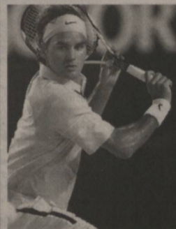
Энди америкалик спортчи ўз ватанида тиббий муолажалар олишга мажбур бўлади.

Теннис бўйича АҚШ терма жамоасининг етакчи спортчиси Энди Роддик Таиландда ўтказилган АТР мусобақасидан озод этилди. Гап шундаки, унинг тавониди жароҳат излари аниқланган. Роддикнинг қачон сафга қайтиши номаълум.