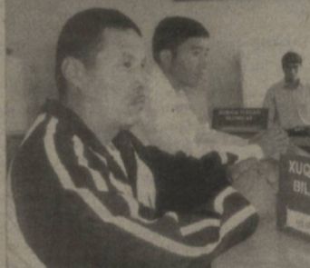
маблағлари банк омонатларига жалб этилмоқда. Жорий йилнинг 1 октябрь ҳолатида аҳоли омонатлари қолдиги 2,5 млрд сўмини ташкил этмоқда. Нафақа ва ёрдам пулларини ўз вақтида тарқатиш ҳамда аҳолига комму-

ли трактор, Сирдарё филиали томонидан "Замин юраги" фермер хўжалигига "Class-Dominator" комбайни, "Қудратли юрт" фермер хўжалигига ТТЗ-80 русумли трактор сотиб олиш учун имтиёзли кредитлар ажратилди. Ҳақ олтин филиал томонидан эса "Анвар султон", "Ка-