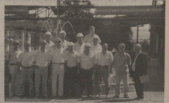
1995 йилда ташкил этилган корхонанинг ҳозирги пайтга келиб Зарафшон, Учқудук, Қизилтепа, Навоий бўлими фаолият кўрсатиб турганлиги тўғрисида.

Раҳбарият ва касба уюшма-си кўмитаси ҳамкорлигида имзоланган жамоа шартнома-си ишдаги асосий дастурил-амалдир. Ҳар ойда ишчилар-