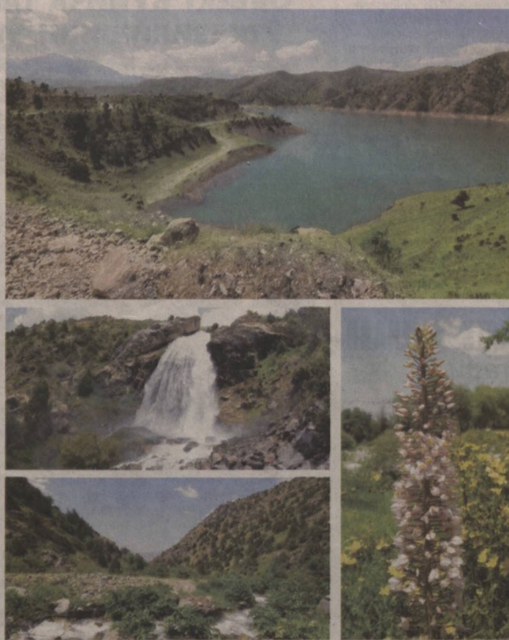
Аскар ЕҚУБОВ (ЎЗА) олган суратларда "Ҳисор" давлат қўриқхонаси манзаралари.

Қўриқхонада табиатни муҳофаза қилиш бўйича илмий-тадқиқот ишлари ҳам олиб борилган. Бу ерда биологик хилма-хилликнинг замонавий ҳолати бўйича стационар тадқиқотларда муайян ютуқларга эришилмоқда. Қўриқхона Ўзбекистон Республикаси Фанлар академияси, олий ўқув юртлири, хорижий илмий ва табиатни муҳофаза қилиш ташкилотлари билан ҳам-