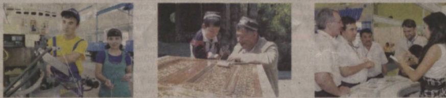
Қўшимча маълумотлар учун минтақавий филиалларнинг кредит бўлимлари телефонлари: