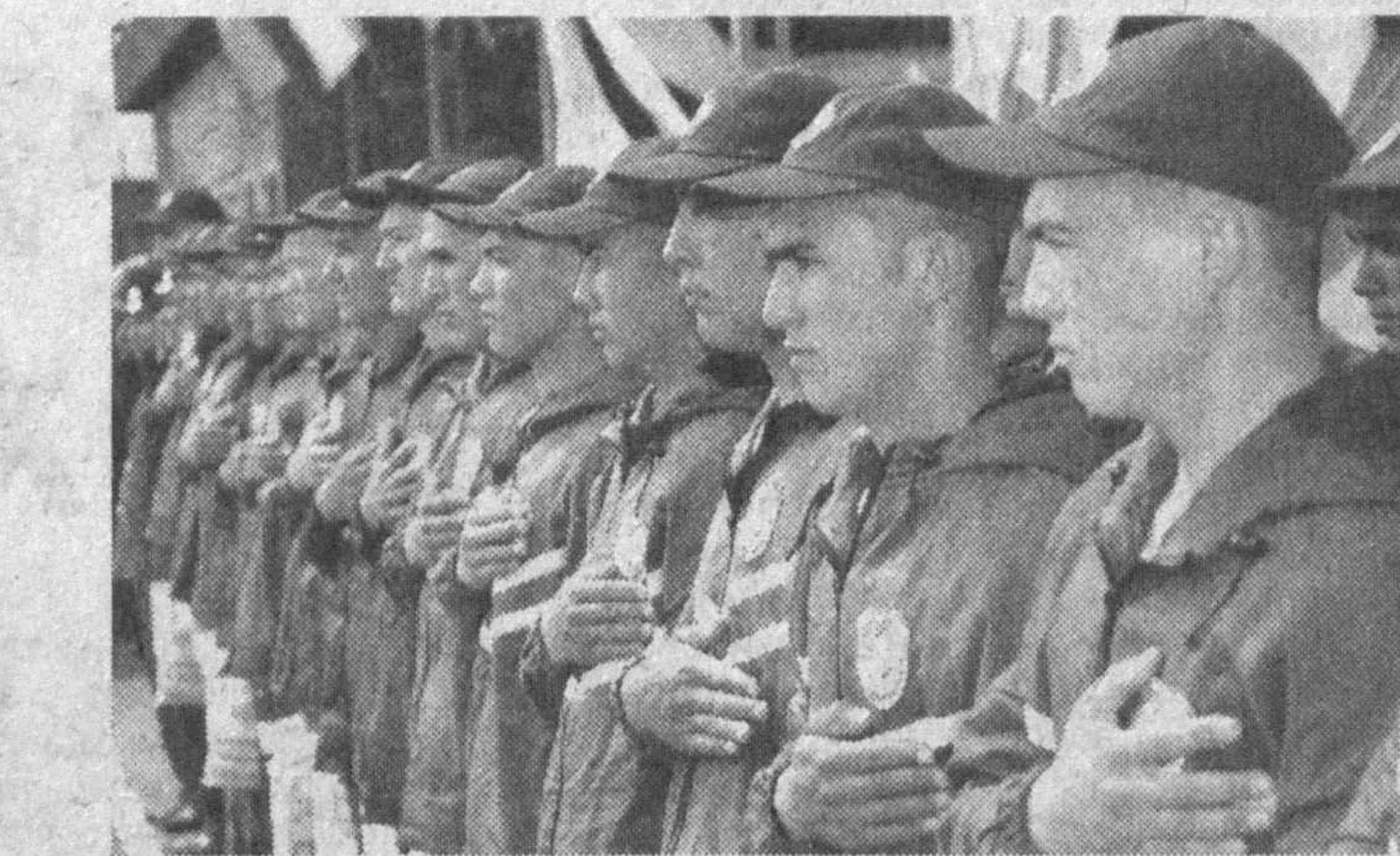
Нигоҳларидан ўт чақнаб турган мана бу ўқтам йигитлар эндиликда Ватан ҳимоячилари ҳисобланишади. Улар пойтахт вилоятининг шаҳар ва туман мудофаа бўлиmlларидаги қақирув пунктларида ташкил этилган танловдан муваффақиятли ўтишди.

Танловда қатнашган йигитларимизнинг саломамлиги, оилавий шароити, интеллектуал салоҳияти, маълумоти ҳам алоҳида эътибор берилди. Майдонда мағрур саф тортиб турган ўғлонларга боқиб, юрт ҳимояси ишончли қўлларда эканлигига ишонсанан киши. Президентимизнинг "Муддатли ҳарбий хизматининг белгиланган муддатларини ўтаб бўлган фуқароларни хизматдан бўшатish ҳамда Ўзбекистон Республикаси Қуролли Қўларига навбатдаги қақирув тўғрисида"ги Қарори асосида ёшларни армияга кузатиш ишлари бошлаб юборилди. Кўни кеча Тошкент вилояти мудофаа ишлари бошқармаси йўғин пунктида бўлажак аскарларнинг навбатдаги гуруҳини кузатиш маросими бўлиб ўтди. Унда қақирлувчиларнинг ота-