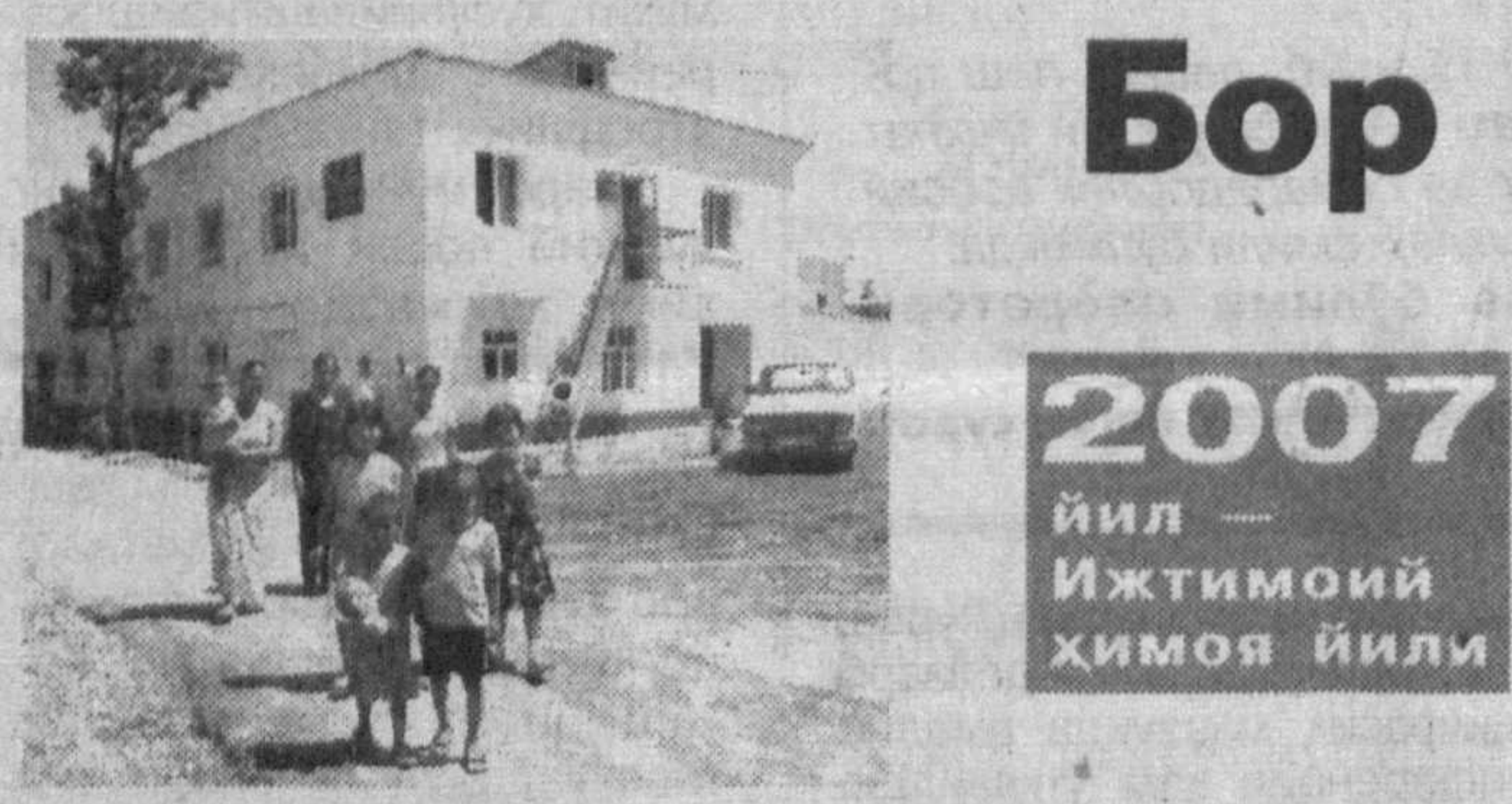
Инсоннинг қудрати жангу жадалда, ур-йўқидат эмас, одамларга бўлган меҳр-оқибатда, муруватпешаликда кўринади. Юраги эзгулик дея урган инсондан ҳар қан-