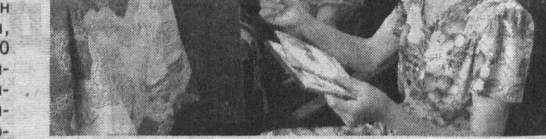
СУРАТЛАРДА: меҳрибонлик гўшаси ҳаётидан лавҳалар.

Гулистон шаҳридаги А. Абдураҳмонов кўчасида жойлашган «Ногиронлар уйи»ни ана шундай меҳр-оқибат масканларидан бири эканлигини алоҳида таъкидласа арзийди. Ушбу бинони таъмирлаш «Ижтимоий ҳимоя йили» давлат дастурига киритилган эди. Яшилларнинг шарофати билан бино қисқа муддатда