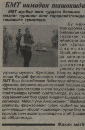
YETTI-IQIMDAN BIR SHINGIL