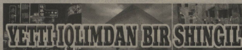
YETTI-IQIMDAN BIR SHINGIL

Келдиёр ЖУРАҚУЛОВ, "Қишлоқ ҳаёти" мухбири. Жиззах вилояти