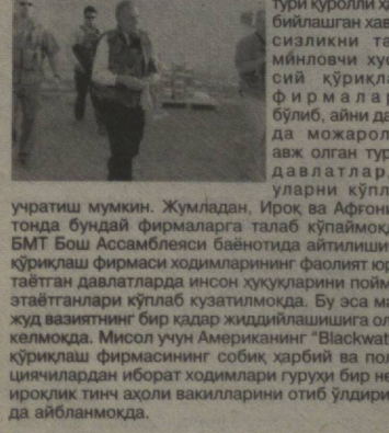
YETTI-IQIMDAN BIR SHINGIL

Жаҳон матбуоти хабарлари асосида Ш.САНАЕВ тайёрлади.