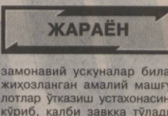
ЖАРАЁН замонавий ускуналар билан жиҳозланган амалий машғуллар ўтказиш устaxonасини қўриб, қалби завққа тўлади.