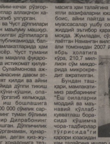
ерланган кийим-кечак рўзгорбор махсуслотлар аллақачон харидорини топиб улгурган.

Бу, албатта, сўнгги йилларда мамлакатимизда молиявий муассасаларга яратилаётган имкониятлар тўғрисидаги уларнинг халқ ичига қилиб бораётганидан ва ўз наъбатида аҳолининг банкларга бўлган ишончнинг ортиб бораётганидан далolatдор. Зеро, бугун бу ҳолат маъмур банкнинг широгига айланган. Энг муҳими, ана шу таъминловчи устувор қўйилаётган бундай ишончнинг мустаҳкамланишига хизмат қилиши шуб-