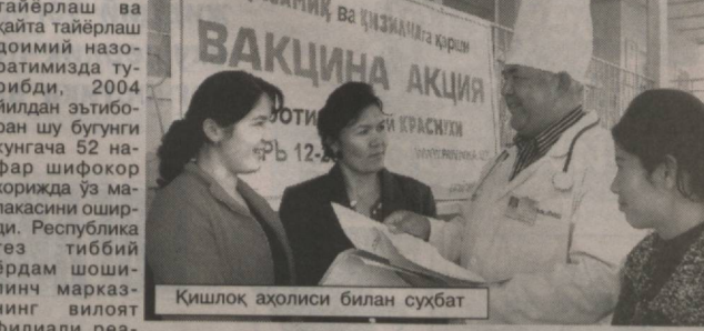
Қишлоқ аҳолиси билан суҳбат

ноан вилоят Соғлиқни сақлаш Бошқармаси тавсияси билан талабар жўнатилди. Шифокорларнинг клиник ординатура, аспирантура, докторантурада бўлиш билан бирга, хил жарроҳлик операцияларини бўғалиқда ўтказиб, тиббиётимизни энг муҳим соҳаларига бағишланган илмий-амалий анжуманларда иштирок этиш билан ҳамкорликда орнитолог ва кардио жарроҳлик бўлимлари ташкил қилиш мумкин. Бу соҳада Ўзбекистон соғлиқни сақлаш вазирлиги ва вилоят ҳокимлигининг амалдорлари билан ҳамкорликда қўриқ хисобидида, ушбу академиянинг малака академиясида бўлиб қайтидан навабатида, ушбу академиянинг малака ошириш институти илмий иш-