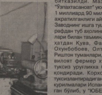
лоятдаги баъзи турдош корхоналар тугатилиб, бошқасига қўшиб юборилди. Фарғона шаҳридаги Бешбола пахта тазалаш заводи тугатилиши ҳисобига Фарғона туманида етиштирилган ҳосил ҳам Риштон пахта тазалаш заводи оқиқ акциядорлик жамиятига топширилди.

Маълумки, жорий йилда "Ўзпахтасаноат" тармоғида ўтказилаётган ислохотлар ҳараёнида Фарғона ви-