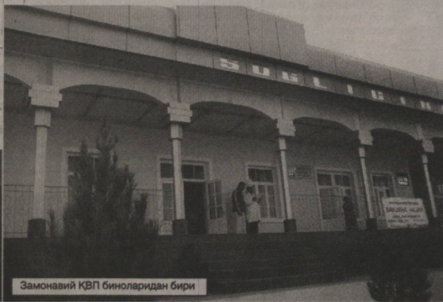
Замонавий КВП биналаридан бири

Бир пайтлар беморга тез тиббий ёрдам хизмати кўрсатиш фақатгина шаҳар марказларидагина қониқарли деб ҳисобланарди. Республикаимизнинг чекка-чекка ҳудудларида эса бемор одам бир неча чақирим масофани босиб, машина ёллаб, не машаққатлар билан марказ шифохоналарига етказиларди. Қишлоқларда мавжуд бўлган касалхоналардаги шарт-шароитлар, ишдан чиққан жиҳозлар ва турли хил таъхир қўядиган аппаратларнинг йўқлиги ҳақида-ку айтмасам ҳам бўлади. Ҳозир эса ҳар бир қишлоқ врачлик пункти қошида тез тиббий ёрдам шохобчаси очилганлиги, унинг тасарруфидаги машиналарнинг ҳамма жиҳозлар билан таъминланганлиги мустақиллик тиббиётини ҳам тўл ўзгаришлар олиб келётганидан далолатдир.