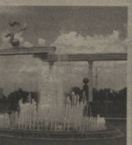
Каримов ташаббуси билан бунёд этилган Мустақиллик ва эзгулик монументи ўзининг улугворлиги, қўруқ салобати билан давлатимизнинг улкан куч-қудрати ва салоҳиятини ифодалаб турибди. У халқини ишонч тимсолидир. Ушбу обида Президентимиз Ислам Каримов гоёси асосида таниқли хайкалтарош Илҳом Жабборов томонидан яратилган. (Давоми 2-саҳифада)

Каримов гурури-ифтихорини юксалтиришга хизмат қилади. Монумент Ўзбекистоннинг тинчликсевар сиёсатини, ўзбек халқининг бунёдкорлик ва фаровонлик йўлидаги эзгу интилишларини акс эттирган ноёб мажмуадир. У мамлакатимиздаги тинчлик, барқарорлик, буюк келажаққа қатъий