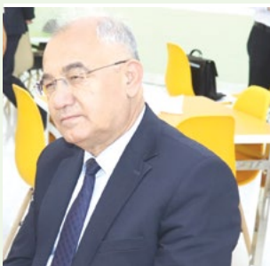
Акмал САЙДОВ, Ўзбекистон Республикаси Олий Мажлиси Қонунчилик палатаси Спикерининг биринчи ўринбосари, академик:

– Бугун Сўх тумани том маънода улкан ўзгаришларга юз тутмоқда. Бу ҳудудда одамларни рози қилиш, оилаларга фаровонлик олиб кириш, аҳоли бандлигини таъминлаш борасида салмоқли ишларга қўл урилмоқда. Айниқса, давлатимиз раҳбари ташаббуси билан Ўзбекистоннинг Фарғона ва Қирғизистоннинг Боткен вилоятлари ўртасидаги чегара постлари фаолияти тикланиб, Қирғизистон орқали ўтган Сўх – Риштон йўлининг очилгани одамлар узоғини яқин, оғирини енгил қилди. Чегаралар очилмасидан олдин эса улар вилоят марказида ёки қўшни туманларга бориб келишда қийинчиликларга дуч келишар эди. Жумладан, йўлнинг узоклиги, чегара ҳудудидаги расмийликлар кўп вақт бой берилишига сабаб бўларди. Бугун эса қиринчилик алоқалари сабаб бу янглиғ машаққатлар ортда қолди.