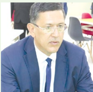
Минжожиддин ҲОЖИМАТОВ, Республика Маънавият ва маърифат маркази раҳбари, сенатор:

лишида иштирок этяпман. Очигини айтсам, бундай замонавий оромгоҳлар ҳамма мамлакатда ҳам қурилавермайди. Ўзбекистонда эса уларнинг сони йил сайин кўпайиб бормоқда. Бу Ўзбекистон Президентини ёш авлодга оталарча ғамхўрлик қилаётганидан далолат беради.