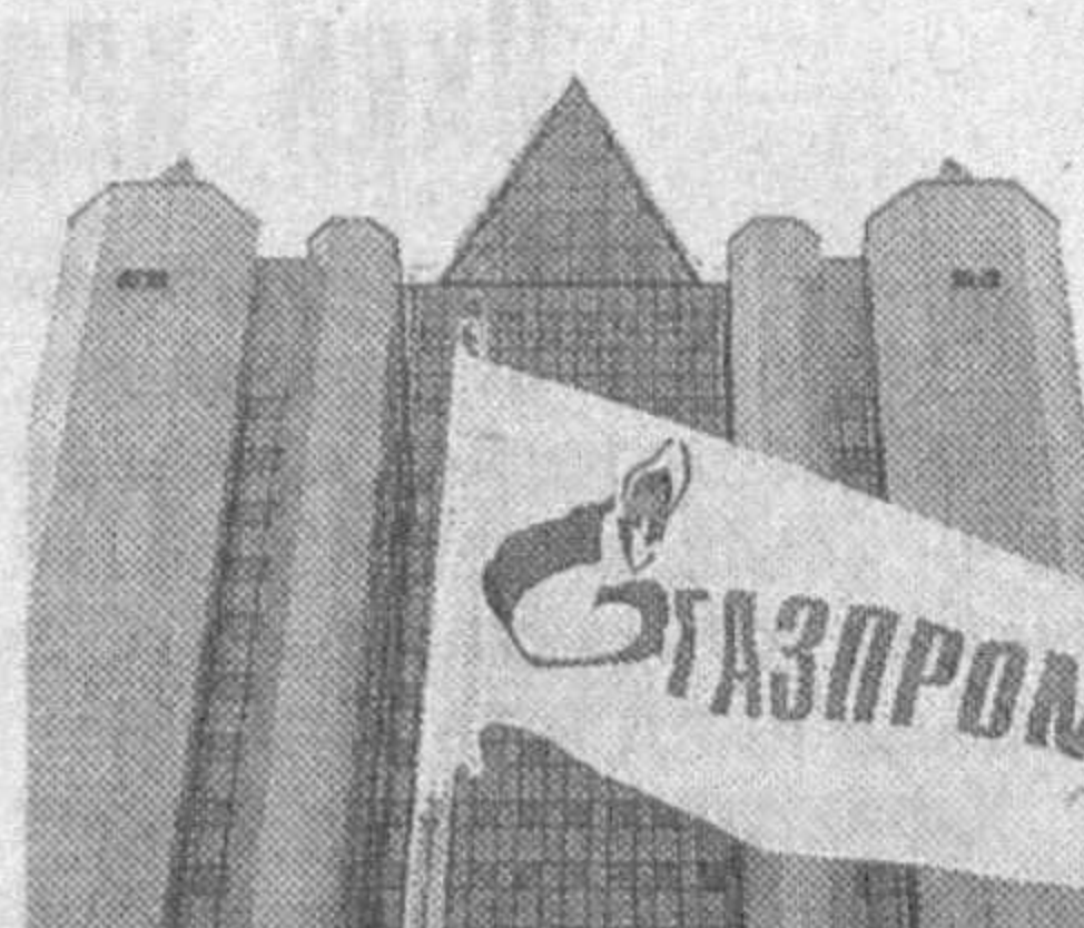
ридаги ҳиссаси икки фоизни ташкил этади.

Бу ҳақда «The Observer» газетаси ҳукумат вакили берган маълумотга таяниб хабар тарқатди. Айни пайтда «Газпром» мамлакат бўйлаб газ тарқатувчи «Centric» компаниясини сотиб олишга ҳаракат қилмоқда. Ҳисоб-китобларга қараганда, «Газпром»нинг Англия энергетика бозо-