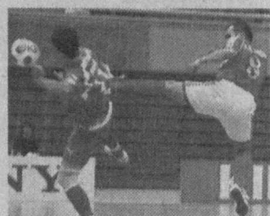
урарлари баҳсида иккинчи ўридан жой олди.

Японияда футбол бўйича якунланган Осиё чемпионатида Ўзбекистон терма жамоаси фахрли учинчи ўринни қўлга киритди.