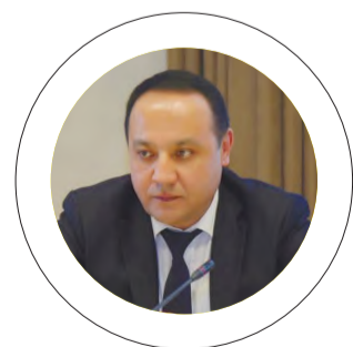
Ақром АРИПОВ, Олий суд бош консультанти