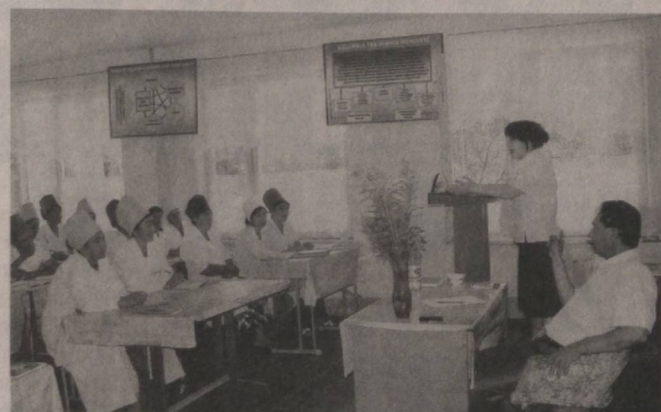
Ушбу услубий маслаҳатлар бериб борилаётганлиги боис, даволаш профилактика муассасаларидаги 72 соатлик ўқув машғулотларининг сифат ва самарадорлигини оширишга эришилди.

Президентимиз раҳнамолигида аҳоли саломатлигини мустаҳкамлаш йўлида изчил ислохотлар амалга ошириб келинмоқда. Хусусан, Ўзбекистон Республикаси Вазирлар Маҳкамаси томонидан 2009 йил 18 декабрда қабул қилинган «Тиббиёт ходимлари малакасини ошириш ва қайта тайёрлаш тизимини такомиллаштириш тўғрисида»ги қарори ҳам ана шу мақсадга хизмат қилаётир. Унинг ижросини таъминлашда ўрта тиббиёт ва доришунос ходимлар малакасини ошириш ва ихтисослаштириш республика маркази Қарши филиалида кенг қўламли ишлар амалга оширилмоқда.