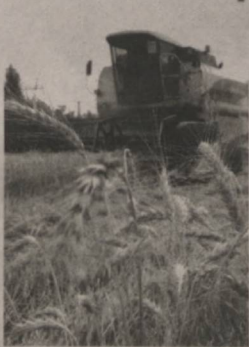
«Краснодар-99» ва «Таня» навларини эккандик. Натижада эса гектаридан 100 центнердан ҳосил олинди.

Ғалакорларимиз эришган ютуқлар — 7 миллион 170 минг тонналик улкан фермерларимизнинг муносиб улуши бўлди. Энг муҳими, жорий йилда деҳқончилигимиз тарихида илгари учрамаган юксак кўрсаткичлар — юқори ҳосилдорлик барчамизда ҳайрат ва ҳавас уйғотди. Баъзи фермер хўжалиқлари галлачиликда 100 центнергача ҳосил олишди. Албатта, бу ҳам фермерлик ҳаракати қаратилган эътиборнинг натижаси эди.