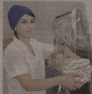
бардош қурилиш материаллари, калава ип, металл идишлар, фарма-

қўшма корхоналар асосан sanoat, қишлоқ ва ўрмон хўжалиги, транспорт, алоқа, қурилиш, савдо каби соҳаларда фаолият кўрсатмоқда. Хитой, АҚШ, Жанубий Корея, Германия, Греция, Буюк Британия, Хиндистон сингари мамлакатлар инвестицияси иштирокидаги корхоналарда маҳаллий хомашёдан рақобат-