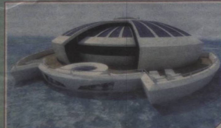
СУВ УСТИДАГИ УЙ