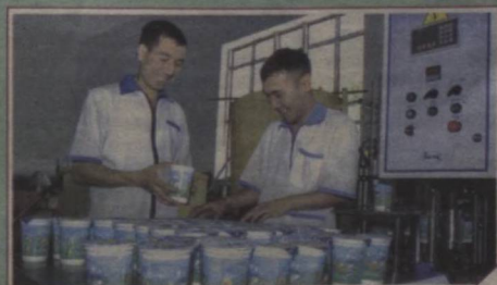
ТАРАҚҚИЁТ ВА ФАРОВОНЛИК ОМИЛИ