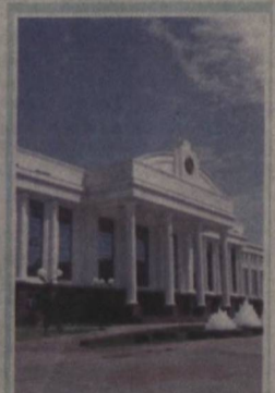
ЎЗБЕКИСТОН РЕСПУБЛИКАСИ ОЛИЙ МАЖЛИСИ СЕНАТИ ТЎҚҚИЗИНЧИ ЯЛИИ МАЖЛИСНИНГ ОЧИЛИШИ ТЎҒРИСИДА

Давлатимиз раҳбари Ислам Каримовнинг 2009 йил 13 апрелда қабул қилинган «Она ва бола саломатлигини муҳофаза қилиш, соғлом авлодни шакллантиришга доир қўшимча чора-тадбирлар тўғрисида»ги қарори аҳолига кўрсатиладиган тиббий хизмат сифатини янада оширишда муҳим дастурий амал бўлмоқда. Республика ихтисослаштирилган акушерлик ва гинекология илмий амалий тиббий марказининг Наманган филиали моддий-техник базаси мустаҳкам, хизмат сифати юқори тиббий муассасалардан бири. 250 ўринли мазкур марказда гинекология ва ҳомиладорлик касалликларини даволашда замонавий тиббий ускуналардан самарали фойдаланилмоқда. Марказда фаолият кўрсатаётган юздан зиёд врачнинг 11 нафари фан номзоди илмий даражасига эга. Бу ерда қўли енгил шифокорлар кўмагида фарзандини соғ-саломат дунёга келтирган бахтиёр оналарга гўдак парвариши, туғуруқлар ораллигини сақлаш, исталамаган ҳомиладорликнинг олдини олиш борасида ҳам батафсил маслаҳатлар берилади. Филиалда педиатр, неонатолог ва акушер-гинекологларнинг мадақасини мунтазам ошириб бориш мақсадида зарур тиббий техника билан жиҳозланган ўқув маркази ташкил этилган. СУРАТДА: ҳамшира Дилором Нуриддинова.