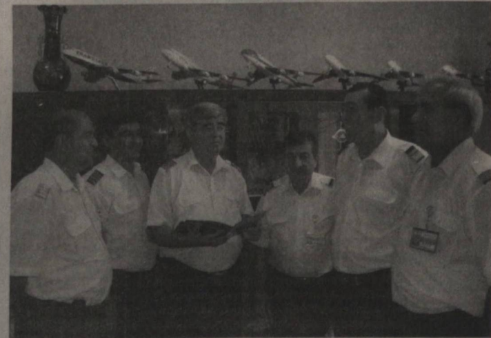
кемаларининг қатновларини ҳам йўлга қўйиш режалаштирилган. Бухоро халқаро аэропорти мустақиллик йилларида барқарор ривожланиш йўлидан дадил одимламоқда. Мазкур аэропорт орқали қадимий ва ҳамisha навқирон Бухорога ҳар кунини юзлаб

Бугунги кунда Бухоро халқаро аэропорти барча тоифадаги ҳаво лайнерларини қабул қилиб, кузатиш имкониятига эга. Утган йили аэропорт меҳнат жамоаси Бухоро — Тошкент, Бухоро — Урганч, Бухоро — Москва, Бухоро — Санкт-Петербург, Бухоро — Краснодар йўналишлари бўйича 102 минг нафардан ортиқ йўловчига хизмат кўрсатди. Бундан ташқари, Россия, Австрия, Италия, БАА каби ўнга яқин давлатларнинг туристик ва бизнес рейслари қабул қилинди.