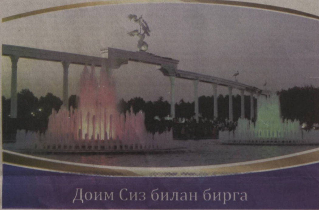
Доим Сиз билан бирга

Маблағларингизни мазкур омонатларда сақлаб даромад олинг, имкониятни қўлдан бой берманг!