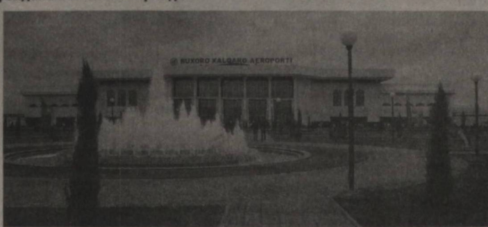
— Бухоро халқаро аэропортида амалга оширилган бунёдкорлик ишлари

ри ҳақида кўп ва ҳўб сўз юритиш мумкин, — дейди аэропорт директори Тоҳир Бахронов. — Президентимиз ташаббуслари билан 2011 йилда аэропортимизда соатига 400 йўловчига хизмат кўрсатадиган, уларнинг барча талабларини қондирадиган янги аэровокзал биноси қурилиб, фойдаланишга топширилди. Шу муносабат билан учинчи-қўнчи йўлакларни таъмирланди, перронлар сонини кўпайтирилди.