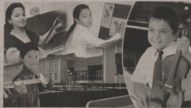
Ўзининг ижобий самарасини бераётир.

Тахлиллар шуни кўрсатадики, 2008 йил бошида умумтаълим мактабларининг 12 фоизига замонавий компьютер билан таъминланган бўлса, 2012 йил 1 июль ҳолатига кўра, таълим муассасаларида сўнгги русумдаги компьютерлар билан жиҳозланган ўқув компьютер хоналари сони 7534 тани, яъни 77 фоизни ташкил этмоқда. Мавжуд 9763 та умумтаълим мактабининг 9403 таси, яъни 96 фоизи "ZiyoNET" тармоғига алоҳида қўшилган. Қолган мактабларни ҳам тармоққа улаш ишлари давом этирилмоқда. Утган ўқув йилида умумтаълим мактабларида фаолият кўрсатаётган ўқитувчиларнинг 416 минг нафари компьютерлар савдоқонлиги борасида ўз билиминини оширди. Тезкор давр талабларига мос тарзда таълим жараёнига жорий этилаётган илғор тажрибалар ҳам шулар жумласидандир. Бугунга қадар тегишли фанлардан 80 номдаги мультимедиа дастурий воситалари ҳамда 26 номдаги ўқув фильмлари, 13 номдаги виртуал лабораториялар яратилди, таълим жараёнига жорий этилди. Информатика фани 8-синфдан эмас, 5-синфдан бошлаб ўқитилиши белгиланди. Ва, бу