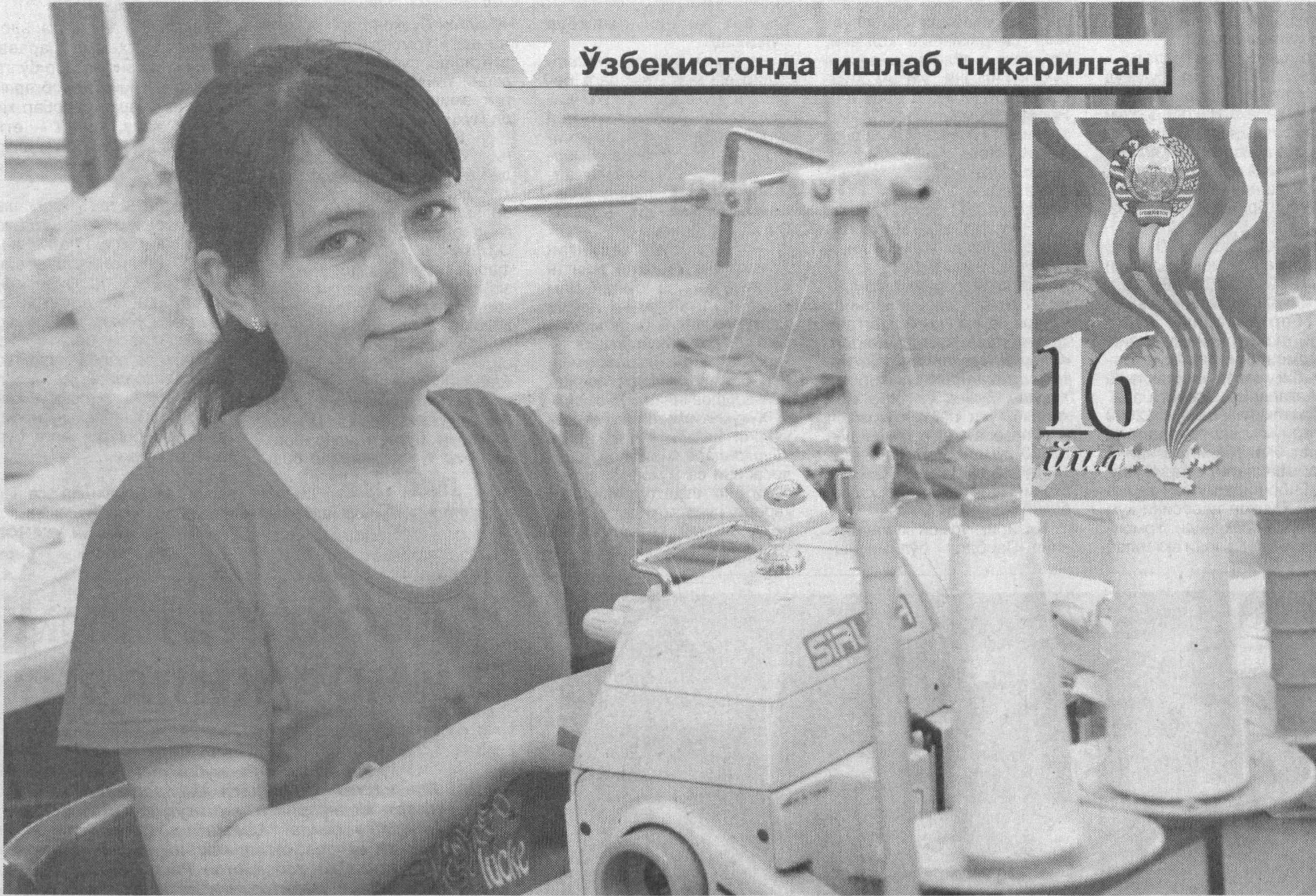
Ўзбекистонда ишлаб чиқарилган