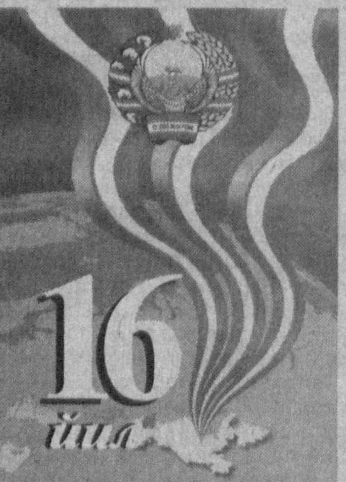
(Давоми. Боши 1-бетда).

нондек азиз эканлигини хизмат жараёнида англаб етдим, уқдим. Мамлакатимиз дахлосизлигини таъминлаш, ота-онам, ака-укаларим, олашнинг қўлини ҳўзур-ҳаловатига пўтур етказмаслигини энг олий бурчим, деб биламан.