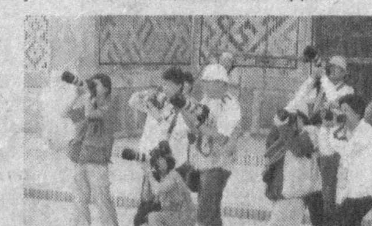
Хорижий ва маҳаллий туристлар учун мўлжалланган ҳудудий дам олиш жойлари ва янги туристик маршрутларни кўпайтириш, экотуризмни янада ривожлантириш мақсадида вил-

Сайёҳлар сонини янада кўпайтириш мақсадида ҳар йили Самарқанд шаҳрида «Ўзбек миллий таомлари ва Шарқ ширинликлари» фестивали, «Самарқанд хунармандлари асарлари» кўргазмаси, «Самарқанд нонлари» ва бошқа турил хилдаги анжуманларни ўтказиш аънанана айланмоқда.