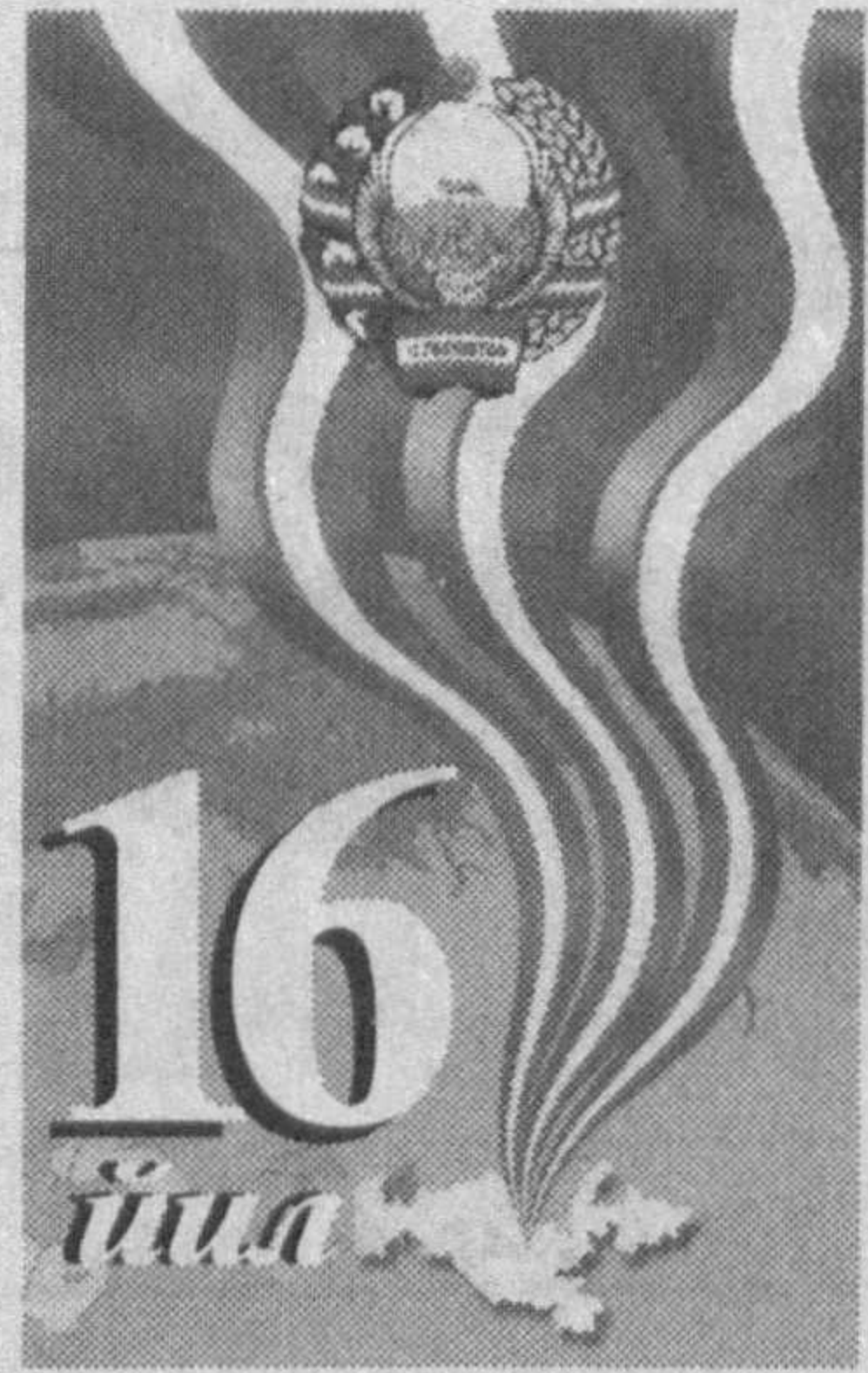
(Давоми. Боши 1-бетда).

«Халқ сўзи» ва ўза мухбирлари хабарлари асосида тайёрланди.