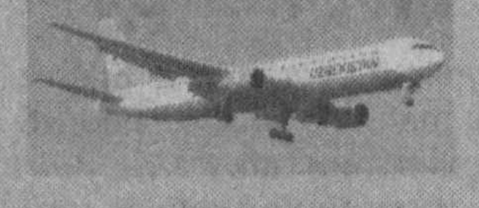
бурж, Қозон, Екатеринбург шаҳарлари ҳам авиацияда оқибат режалаштирилмоқда.

Қарши аэропортидан завоначай «Бойнг-757» яна кемаси Россия Федерацияси пойтахти Москва шаҳрига йўл олди. Энди «Узбекистон ҳаво йўллари» миллий авиакомпаниясининг «Бойнг» русумли самолётлари янги йўналиш билан мунтазам қатнайдиган бўлди. 180 нафар йўловчи олинган бу самолётларда хизмат кўрсатиш даражаси халқаро талабларга тўлиқ мос келади.