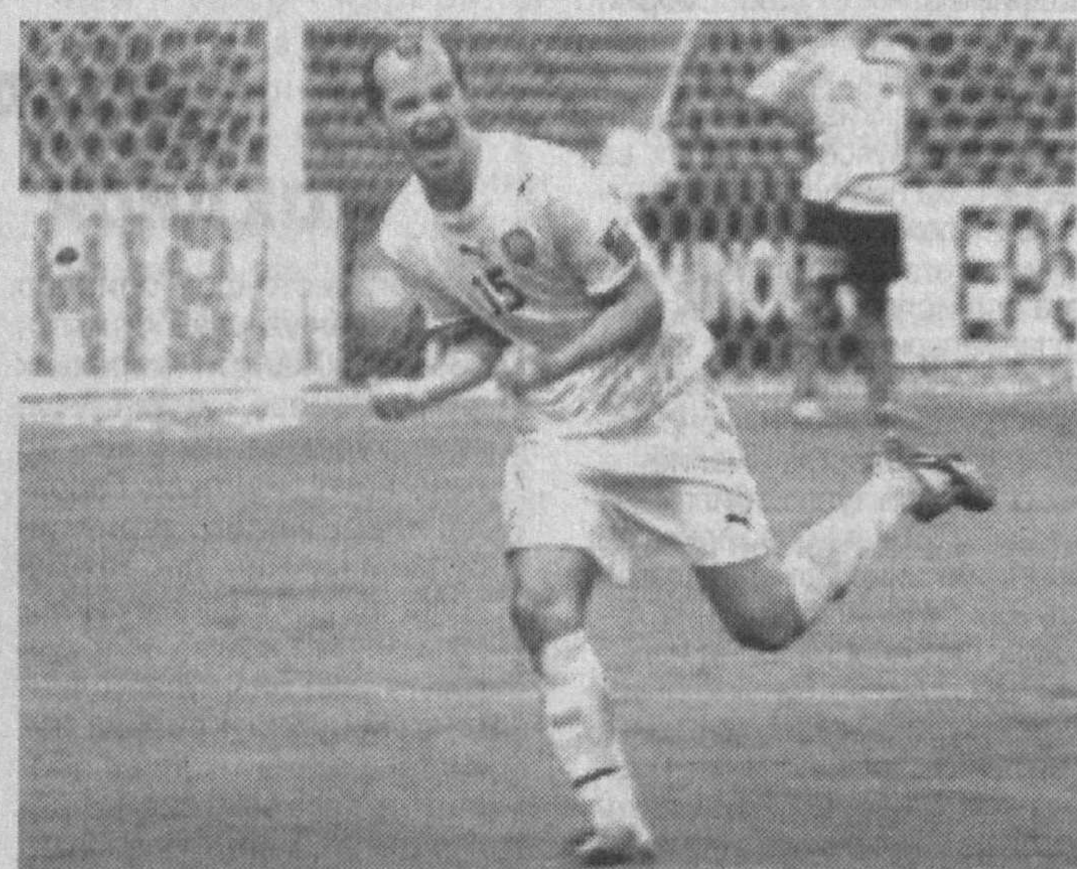
Шоғирдларим жуда ажойиб футбол намойиш этишди. Буни ишқибозлар тўғри тушунишди, деб ўйлайман. Лекин якуний натижа...

— Бундай юқори даражадаги ўйинлар доимо оғир кечада ва кутилмаган натижаларни тақдим этади. Лекин бугун омад рақиб томонда бўлди. Биринчи бўлимда Максим Шаақчи томонидан киритилган голни ҳакам ҳисобга олмади. Энди хатога йўл қўйган ҳакамларни айбланишнинг фойдаси йўқ. Бу борада мутахассису мутаассадилар фикрини айтишар. Асосийси,