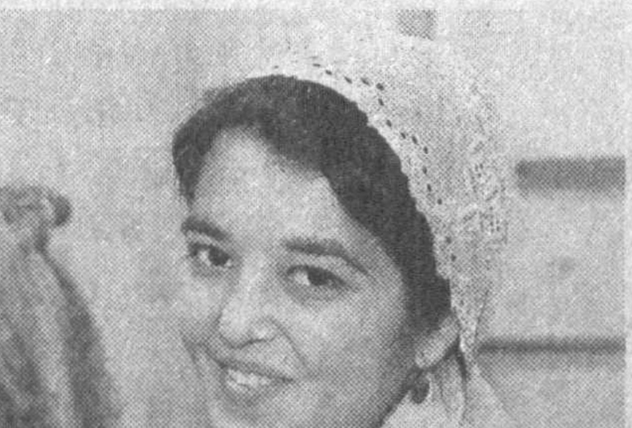
Баркамол авлод тарбияси

Янги ФХДЕ бўлимида турт нафар ёш келин-кўевларни расмий никоҳдан ўтказиш маросими бўлди. Ёш оила аъзола-