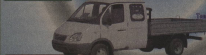
6 ўринди, 2 тонна юк кўтарувчи, "GAZ-33072-Фермер" акцияли машина

Манзил: 100015, Тошкент ш. Шаҳрисабз кўчаси 16'-уй, Тел/факс: (99871) 256-13-01, 256-10-36, 256-03-62, 126-12-94, Автосалон: 127-69-60, 140-41-22, 140-41-21, E-mail: info@auto.uz, Web-site: www.auto.uz