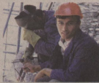
давом эттирилди. Шунинг билан айтиб

даги янги рақамли автомат телефон станциялари ушбу алоқа линиясига уланди. Вилоятда минтақавий оптик толали кабель линиясини ўрнатиш жараёнлари Фузур, Қамаш, Яққабоб, Чироқчи каби туманларда ҳам