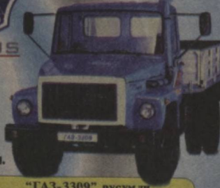
"GAZ-3309" русумли 4,5 тонна юк кўтарувчи машина