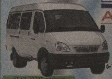
"GAZ-3221" русумли 13 ўринди микроавтобус