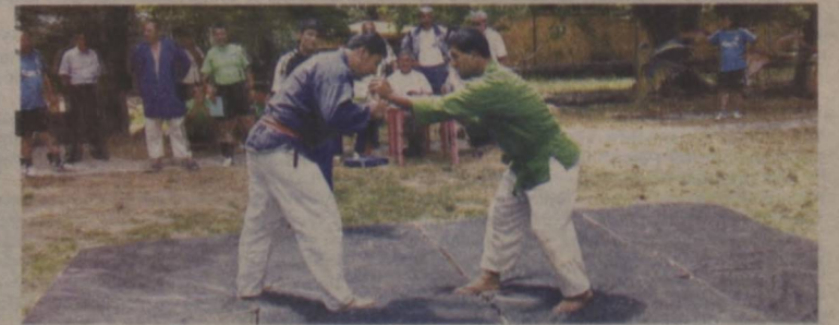
Тошкент вилоятидаги "Семург" болалар соғломлаштириш оромгоҳида Агросаноат тармоғи меҳнатқашлари ўртасида спартакиа бўлиб ўтди.

Мамлакат иқтисодий ривожига Агросаноат мажмуининг тутган ўрни жуда катта. Соҳа ходимларининг машаққатли меҳнатини қадрлаш, уларнинг дам олишлари учун етарли даражада шароит яратиш бериш, иш шароитларини яхшилаш, маданий-маърифий тадбирларни ташкил қилиш, ижтимоий муҳофаза қилиш Агросаноат мажмуи ходимлари касаб ва уюшмаси Марказий Кенгашининг муҳим вазифаси ҳисобланади.