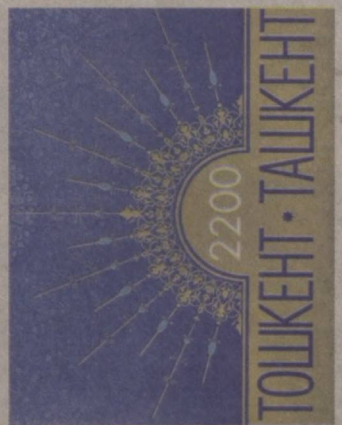
хар мақомига, Марказий Осиё минтақасидаги энг йирик сиёсий-маданий марказ сифатидаги ўрни ва мавқеига ҳар

Номланган дастлабки бобда Тошкент воҳасидаги энг кўҳна одамзот манзилгоҳлари, у ерлардан топилган меҳнат қуроли, қроташларга ишланган расмлар, фил сўғидан ясалган хайкалча ва бошқа тарихий осори атиқалар ҳақида атрофлича фикр юритилади. "Тошкент 1860-1990 йилларда" деб номланган иккинчи бобда тарихий лавҳа ва суратлар асосида пойтахтимизнинг XIX аср ўрталаридаги ҳамда ҳозир мустақиллик ва собиқ мустақиллик давридаги мураккаб ҳаёти ҳақида сўз боради. Альбомнинг учинчи боби "Бугунги Тошкент" деб аталади. Бу бобда Тошкент шаҳрида ўн саккиз йил давомида амалга оширилган улкан тарихий ишлар кенг ёритилади. Давлатимиз раҳбари мустақилликнинг илк кунларидан бошлаб Тошкент ўзининг пойтахт ша-