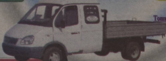
6 ўриндиқ, 2 тонна юк кўтарувчи, «ГАЗ-330232-Фермер» автотранспорти