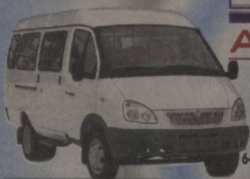
«ГАЗ-3221» русумли 1,5 ўриндиқ микроавтобус

РОССИЯ ФЕДЕРАЦИЯСИ «ГАЗ» ОАЖНИНГ ЎЗБЕКИСТОНДАГИ РАСМИЙ ЭКСКЛЮЗИВ ДИСТРИБЬЮТЕРИ