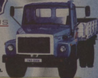
«ГАЗ-3309» русумли 4,5 тонна юк кўтарувчи машина

«ГАЗ» русумли 50 хилдан зиёд автотранспорт — 1,5-4,5 тонналик юк машиналари, 3-7 ўриндиқли, 0,8 тонна юк кўтаридиган фургонлар, 6-15 ўриндиқли микроавтобусларни сотади. Ҳақ тўлаш исталган усулда!