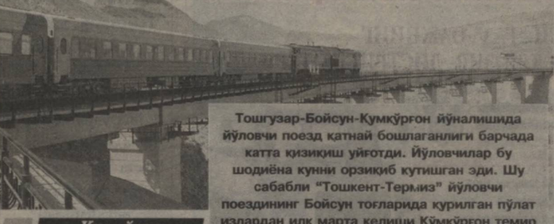
Тошгузар-Бойсун-Кумкўрғон йўналишида йўловчи поезди катнай бошлаганлиги барчада катта қизиқиш уйғотди. Йўловчилар бу шодиёна кунни орзиқиб куттишган эди. Шу сабабли "Тошкент-Термиз" йўловчи поездининг бойсун тоғларида қурилган пўлат изарлардан илк марта келиши Кўмкўрғон темир йўл вокзалида қизгин кутиб олинди.

Радиокарнайдан поездининг Кумкўрғон вокзалига кириб келаётганлиги эълон қилиниши йўловчиларнинг шоду ҳуррамлигига улашиб кетди. Карнай-сурнай саҳолари янгради. Юқори мартабали меҳмонлар, темирйўлчилар, оммавий ахборот воситалари ходимлари вокзал перронига поездини кутиб олиш учун пешвоз чиқдилар. Уларнинг қувончи янги йўлдан ўз манзилига етиб келган йўловчиларнинг хурсандчилиги билан уйғунлашиб кетди.