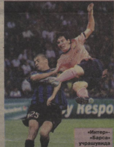
«Интер»-«Барса» учрашувида ҳисоб очилмаган бўлса-да, ўйин кескин руҳда ўтди.

“F” гуруҳи вакиллари “Интер” (Италия) — “Барселона” (Испания) қарама-қаршиликдаги турнинг марказий учрашуви сифатида қаралган эди. Сабаби, мавсум бошида ушбу икки жамоа ўзларининг етакчи футболчилари — Ибрагимович (“Барселона”) ва Это’Они ўзаро алмаштириб олишган эди. Икковининг ҳам собиқ жамоадоларига қарши қандай ўйин кўрсатиши кўпчиликни қизиқтириши табиий. Яъни бу ўйин бир тарафдан гуруҳ етакчиларининг кураши бўлса, бошқа тарафдан икки форвард Ибрагимович—Это’О қарама-қаршилик эди. Кўпчилик ушбу ўйинни жуда кескин ва албатта голларга бой бўлиши кутган эди. Аммо Миланда бўлиб ўтган ўйин курак дуранг — 0:0 билан якунланди. Ўйин суръати кескин кечган бўлса-да, жамоалар эҳтиёткорлик билан ҳаракат қилишди ва бутун жамоа бўлиб ҳужумга ўтишга ошиқмади. Афтидан, қайд этилган натижа “Интер” мутасаддиларини қониқтирган кўринади. Ҳужумкор “Барса” эса масалани ўз ўйида ҳал қилмоқчи, шекилли. Каталонияда “Интер” дарвозаси томон “ҳужумлар ёмири” ёғилиши турган гап. Аммо 0:0 “Барса” учун қалтис ҳисоб эканини таъкидлаш жоиз. Миланликлар меҳмонда биринчи бўлиб тўп киритиб олса, “Интер” дарвозаси ҳақиқий қўрғонга айланиши аниқ.