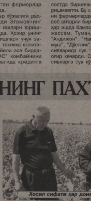
Ҳосил сифати ҳар доим эътиборда.

бу йилда биринчиликни қўлдан бeришмапти. Бу илгорликнинг сирини фермерлардан сўрасангиз, жавоб айтганли бир хил бўлади. Яъни хар ишда бамаахлахат ҳаракат муҳим. Тумандаги “Гулистон”, “Андажон”, “Намуна”, “Янги турмуш”, “Дўстлик”, “Маданият” масисивларида сув таъминоти ҳаммиша оғир кeчади. Сабаби, ушбу масисивларга сув қўшни мамлакатдан