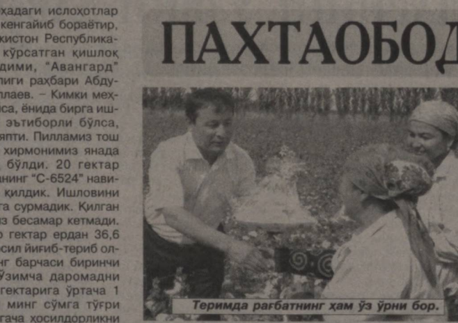
Ҳосил сифати ҳар доим эътиборда.